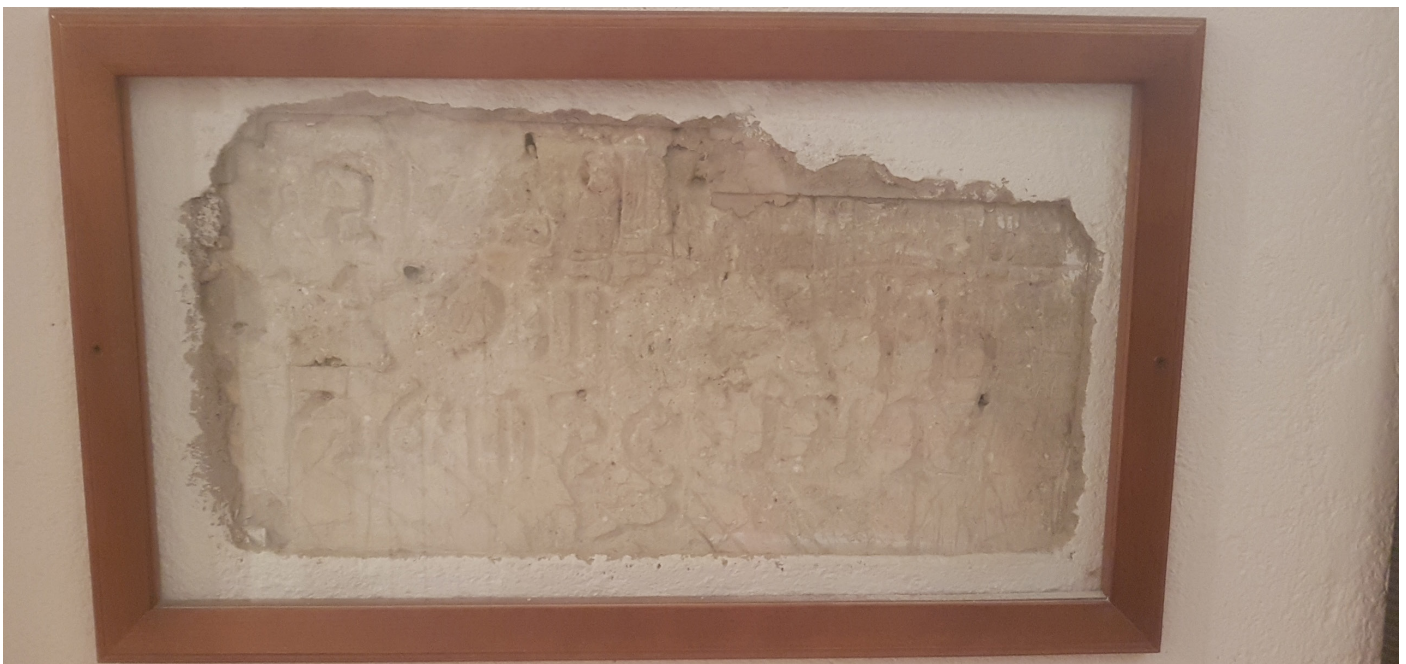
(Scritta in ebraico incisa dagli ebrei nei muro del sotterraneo dell'episcopio in cui erano nascosti)

COME PRENOTARE: Per la prenotazione delle attività didattiche si richiede di contattare telefonicamente allo 075.812483 al fine di verificare la disponibilità del Museo. Successivamente inviare la scheda di adesione allegata, compilata in tutte le sue parti, all'indirizzo di posta elettronica assisimuseodellamemoria@gmail.com con almeno 20 giorni di anticipo rispetto alla data prescelta della quale va comunque verificata la disponibilità.