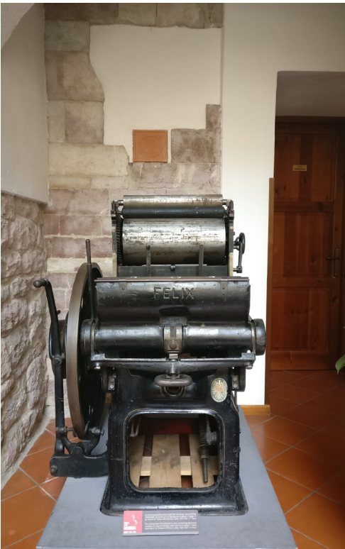
La macchina tipografica che ha stampato i documenti falsi