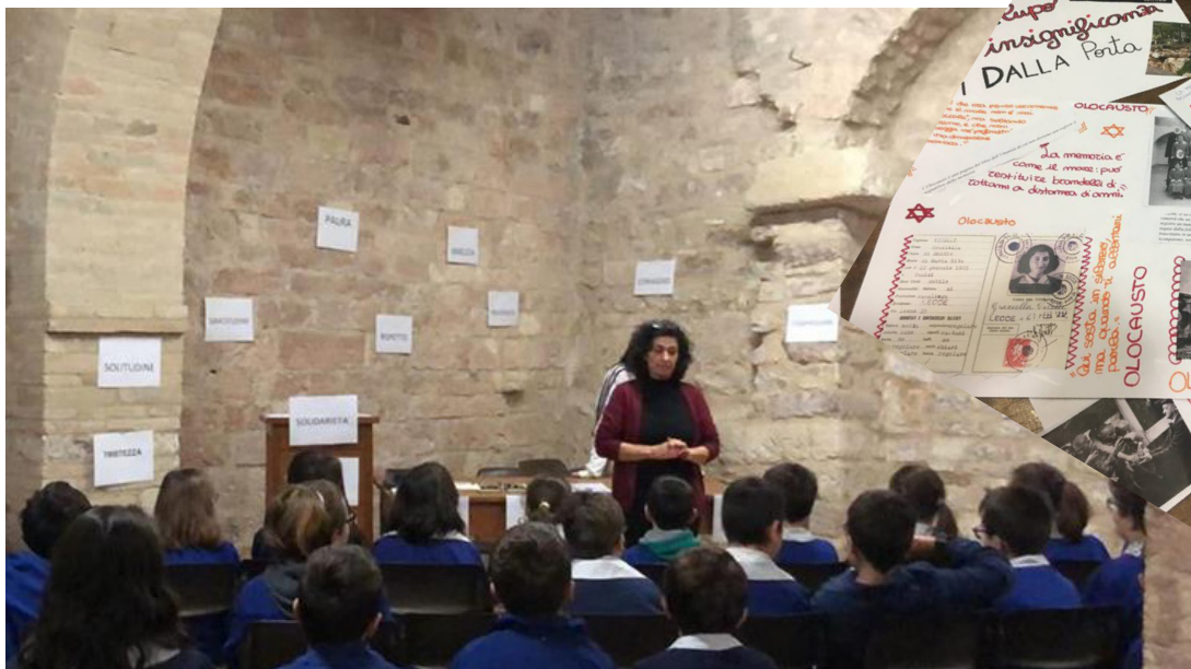
Alunni della scuola primaria al Museo della Memoria