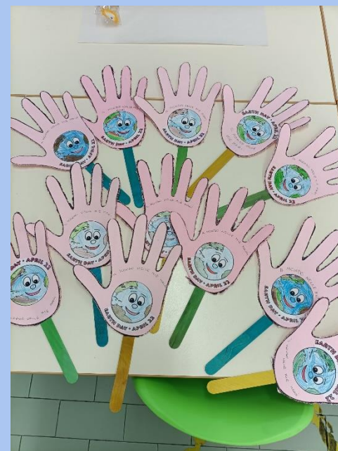
GIORNATA DELLA TERRA