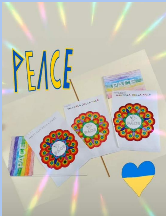
GIORNATA DELLA PACE